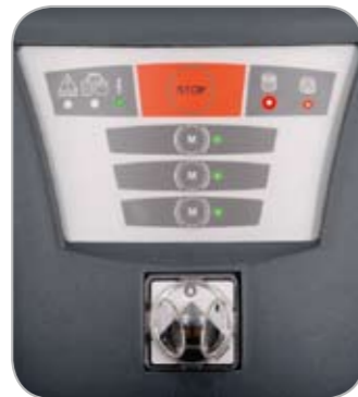
Waarschuwing verstopping in hoofdfilter en absoluutfilter