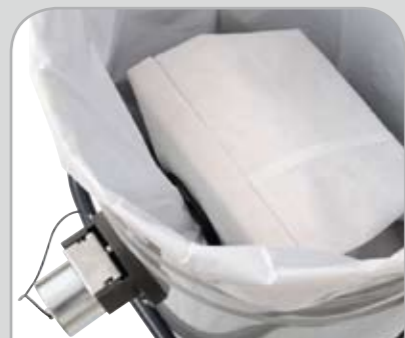
Veiligheidszak voor gevaarlijk materiaal