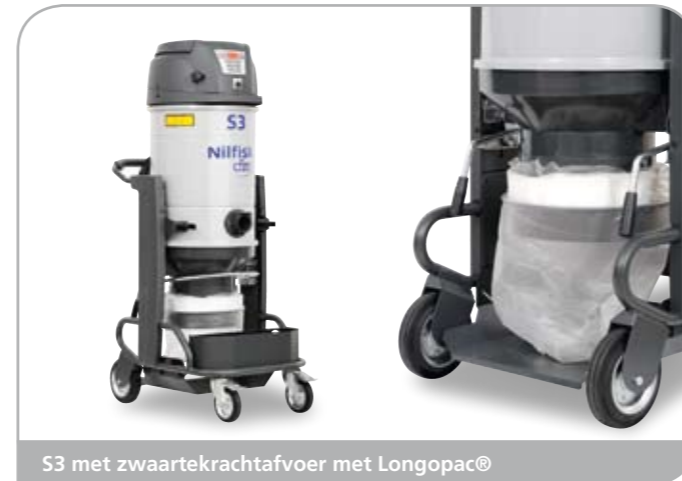
S3 met zwaartekrachtafvoer met Longopac®

Van vuilafvoer tot het verplaatsen van de stofzuiger, ontdek de nieuwe mogelijkheden van deze serie voor uw bedrijf