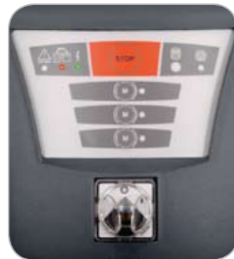
Waarschuwing maximumpeil vloeistof/vaste stof