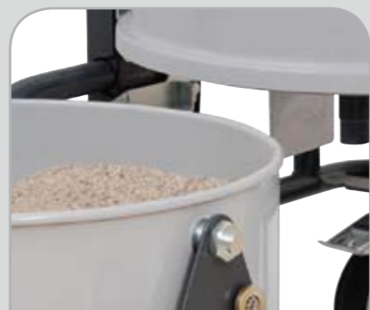
Uitschakelsysteem Vaste Stof (SC)